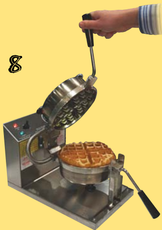
... öppnar du och lyfter ut den nygräddade våfflan.