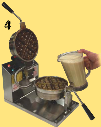
Använd en tillbringare eller dyl...