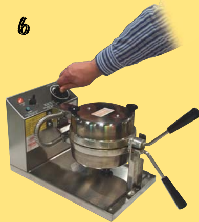
Ställ in rekommenderad tid.