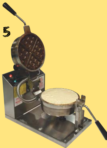
... och fyll våffelmixen ända ut till kanten.