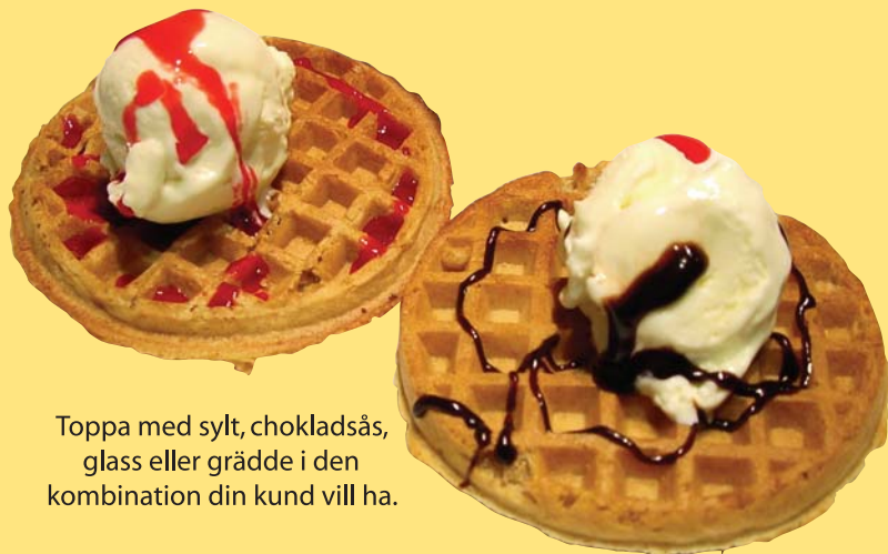
Toppa med sylt, chokladsås, glass eller grädde i den kombination din kund vill ha.