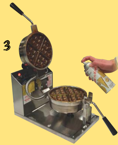
Spraya på Seas'n Kleen.