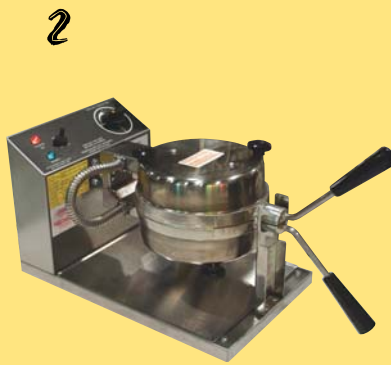
Vänta tills den gröna lampan lyser.